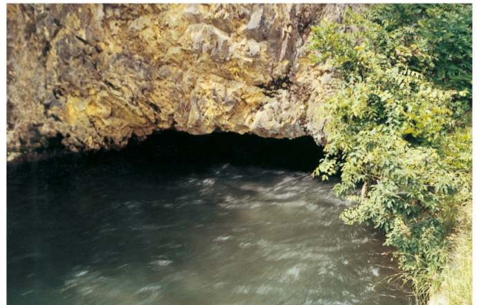
旧鹿妻穴堰頭首工取水口

この間、大正15年（昭和元年 1926）には、鹿妻穴堰耕地整理組合の設立があり、鹿妻本堰より分水する幹線水路の開鑿並びにこれにともなう耕地整理を施行したが事業完了とともに昭和22年（1947）、本区の前身鹿妻穴堰普通水利組合に合併した。また同24年（1949）には大正9年（1920）に設立されていた新山野耕地整理組合が、昭和46年（1971）には煙山土地改良区が、さらに同50年（1975）には不動土地改良区がそれぞれ吸収の形で本区に合併するにいたっている。