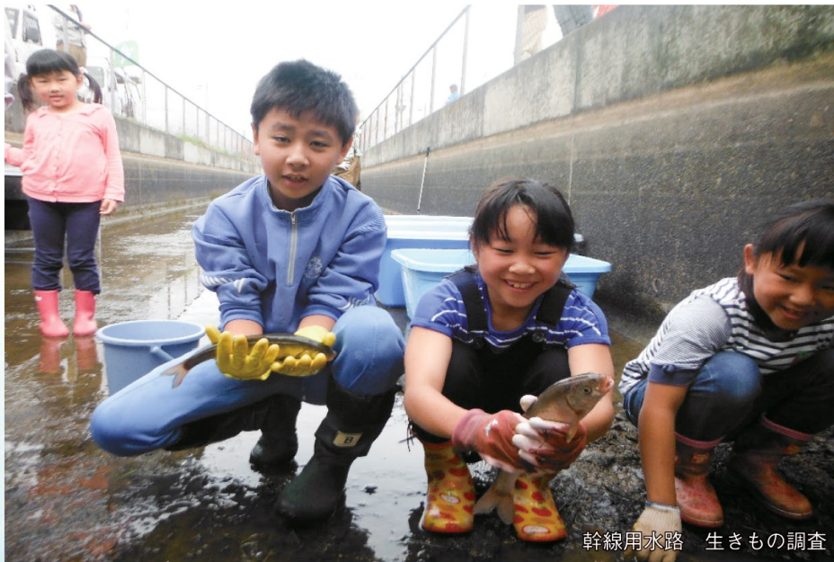
幹線用水路 生きもの調査