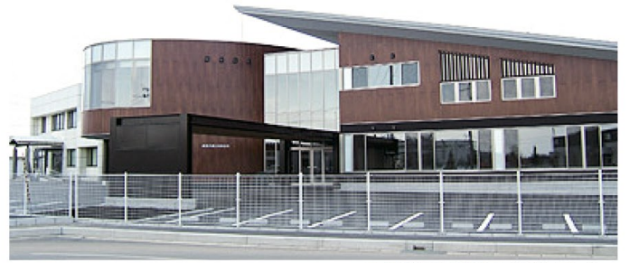
事務所及び用水管理センター

本区区域は、県都盛岡市及び矢巾町、紫波町によって構成されているが、近年、人口の都市周辺への集中傾向が強まるにともなって、市街化区域内農地の宅地等への転用が激増しており、用排水路への汚濁水排出等、都市化により深刻な問題も生じているため、昭和59年から管内関係市町と鹿妻穴堰管内水路等利用調整連絡協議会を設置し対策等を協議しながら、管内の水利機能を適切に維持するよう努めている。