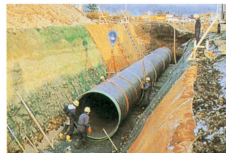
鹿妻本堰用水路・西部用水路