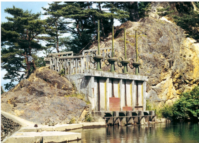
旧鹿妻穴堰頭首工

また、御用水堰に鹿妻の名が冠せられたのは、旧鹿妻村地域に引水することを目的としたことに由来している。