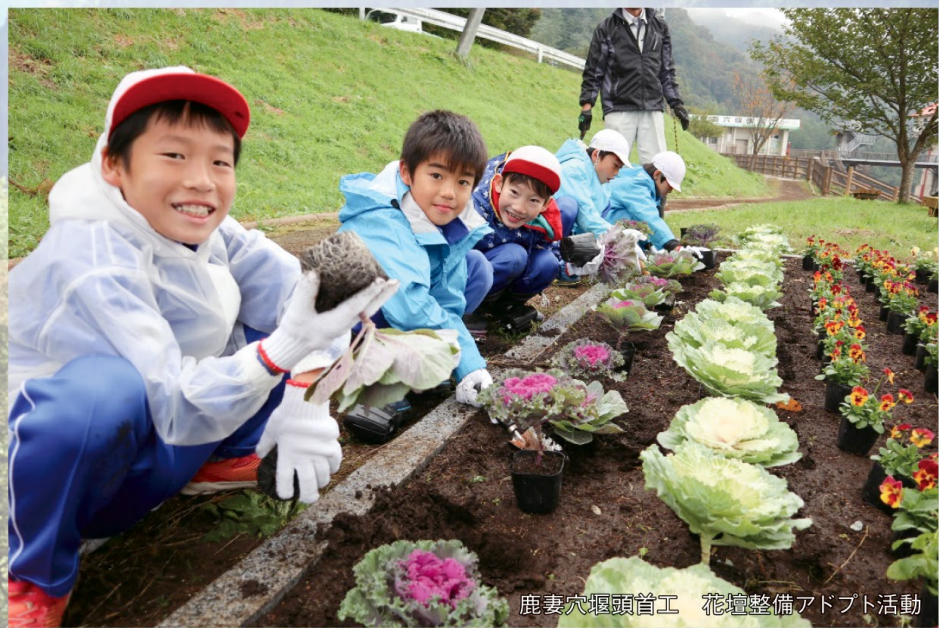
鹿妻穴堰頭首工 花壇整備アドプト活動